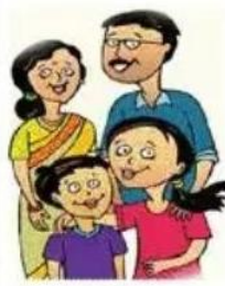
कौटुंबिक जीवन, ताणतणाव, आरोग्य याबाबत फ्युचर जनरली इंडिया लाइफ इन्शुरन्स आणि मार्केट

पुणे : नोकरीमुळे शहरातील कौटुंबिक जीवनावरही परिणाम होत असून, यामुळे ताणही वाढत आहे. पुण्यातील जवळजवळ ५१ टक्के लोकांच्या मते नोकरीमुळे त्यांना कुटुंबाला वेळ देता येत नाही तर अन्य ४० टक्के लोकांच्या मते नोकरीदरम्यान त्यांना घराबाहेर अधिक काळ घालवावा लागतो. तर २७ टक्के वडील मुलांच्या भविष्याला प्राधान्य देत आहेत. तर केवळ १८ टक्के लोक स्वतःच्या आरोग्याची काळजी घेत असल्याचे समोर आले आहे.