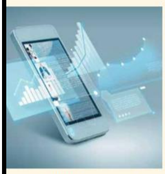
18 Banking Frontiers May 2020

payment gateway." She adds that with integrated machine-learned investment advisory models at the backend, Sharma ji will become a powerful interactive tool enabling a differentiated investment experience to the customer.