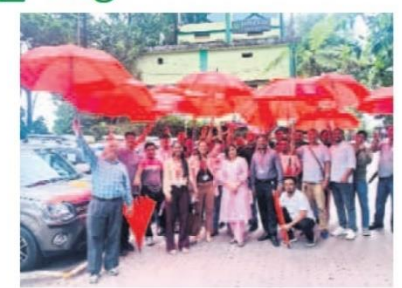
ప్రచారంలో ఫ్యూచర్ ఔనరాలి ఇండియా ప్రతినిధులు

హైదరాబాద్, అక్టోబర్ 31 (స్టర్ల న్యూస్): భారతీయ జీవిత బీమా రంగంలో విశ్వసనీయమైన జీవిత బీమా సంస్థల్లో హ్యాదర్ జెనరాలి ఇండియా లైఫ్ ఇన్స్టూరెన్స్ కంపెనీ లిమిటెడ్ ఒకటి. సిక్కిం రాడ్ట్ల బ్రజల కు బీమాపై అవగాహన, ఆర్టిక భద్రతను పెంపొందించ డానికి అంకితభావంతో చురుగ్గా కృషి చేస్తోంది. భారతీయ బీమా నియంత్రణ మరియు ఇన్స్టూరెన్స్ రెగ్యులేటరీ అండ్ డెవలప్ మెంట్ అథారెటీ (ఐ.ఆర్.డి. ఎ.ఐ.) ఈ సంస్థను సిక్కిం రాడ్ట్రంలో డ్రధాన బీమా సంస్థగా నియమించింది. ఈసందర్భంగా ఫ్యూచర్ జెనరాలి ఇండియా లైఫ్ ఇన్స్టారెన్స్ కంపెనీ లిమిటెడ్ చీఫ్ మారె,టింగ్ ఆఫీసర్, సిక్కింకి ఇండియా ప్రాజెక్ట్